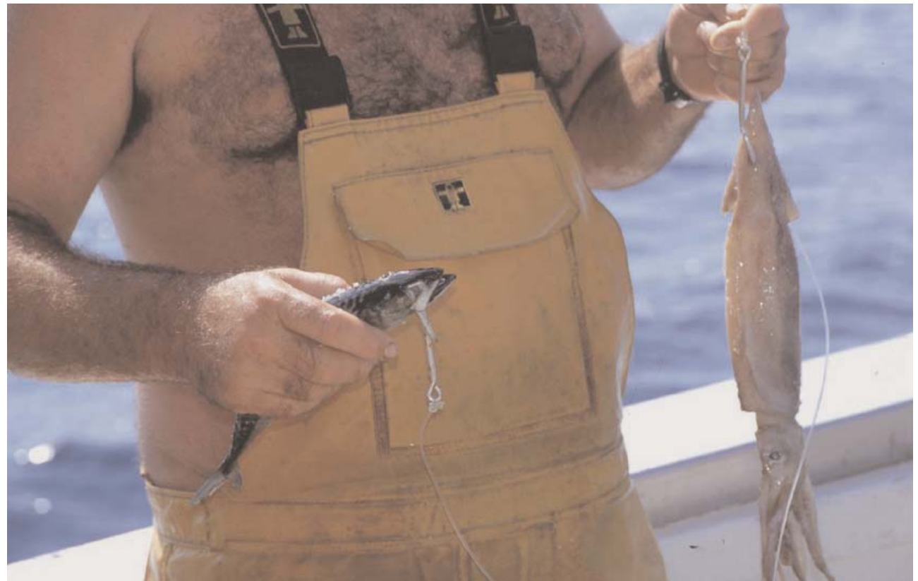
Durante la Acción Piloto de pesca experimental se utilizaron cuatro tipos de carnada de dos especies: caballa y pota.