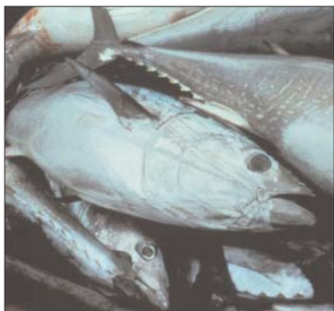
Atunes rojos.

E l pasado agosto en las costas de Cartagena, una veintena de atunes rojos abandonaban sus jaulas de engorde para recuperar la libertad y emigrar a las aguas del Atlántico. La empresa Ricardo Fuentes e hijos fue la encargada de conceder dicha licencia y poner en marcha el experimento científico en cola-