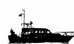
(ES) José M a Navaz - 18 m.

El buque José M a Navaz se utiliza habitualmente en trabajos y campañas oceanográficas en el entorno de las rías gallegas (Vigo, Pontevedra, Arosa y Muros-Noya).