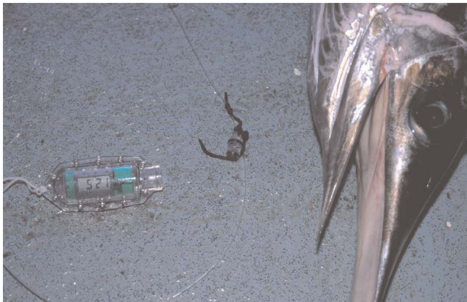
Los cronómetros de anzuelo permiten conocer la hora de picada de los ejemplares capturados.

un patrón de explotación sostenible y rentable para el sector.