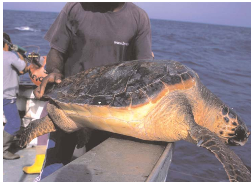
Los ejemplares de tortuga boba ( Caretta caretta ) capturados durante la Acción Piloto, fueron marcados y liberados.

• Estudiar el efecto de la selectividad del aparejo experimental y del tradicional sobre el recurso y la rentabilidad de las embarcaciones para establecer