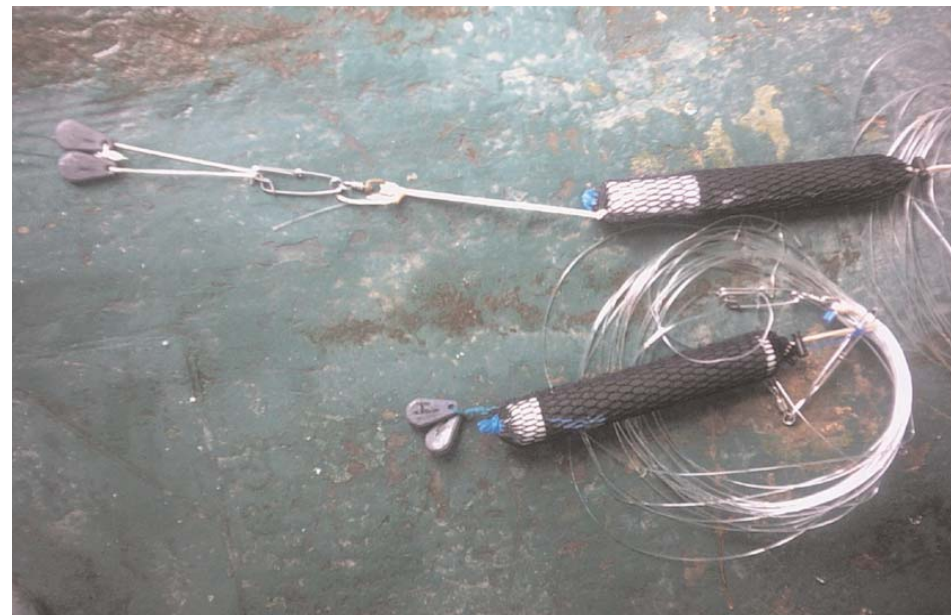
Mediante el empleo de sensores de profundidad y temperatura se conoció la profundidad real de calado de los anzuelos y temperatura de las aguas.

• El tipo de anzuelo no demostró diferencias significativas en cuanto a la selectividad en relación con el pez espada, excepto para los anzuelos 16C (menos selectivo) y para los anzuelos de mayor tamaño 18C y 18T que