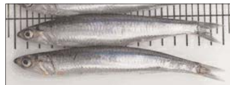
Ejemplares de boquerón.

La UE estudiará la situación actual de la anchoa en el golfo de Vizcaya en una reunión prevista para el próximo mes de diciembre, y los resultados de la campaña Pelacus-1006 tendrán gran importancia en la decisión que tome finalmente la UE.