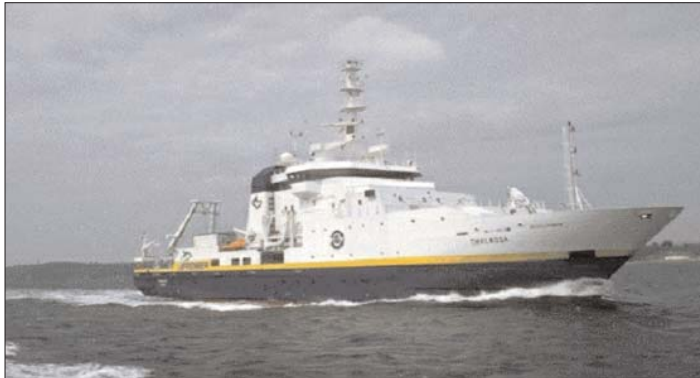
El BO Thalassa participó en la campaña de investigación Pelacus-1006.

El Instituto Español de Oceanografía (IEO) llevó a cabo, desde el 22 de septiembre y hasta el 17 octubre, la campaña de investigación oceanográfico-pesquera Pelacus-1006. A bordo del buque oceanográfico Thalassa , los investigadores del IEO y otras instituciones analizan la situación de la anchoa, una especie pesquera de gran valor económico para la flota española y que, en los últimos años, presenta graves dificultades en la pesquería.