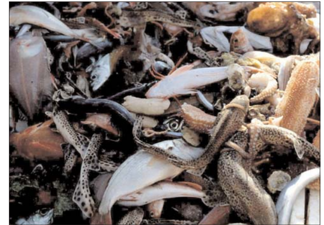
Muestra de la comunidad demersal cantábrica.

En los últimos años ha cobrado gran relevancia el estudio de los efectos que la pesca provoca sobre los ecosistemas marinos. La gestión de las pesquerías ha pasado a ser, no solo,