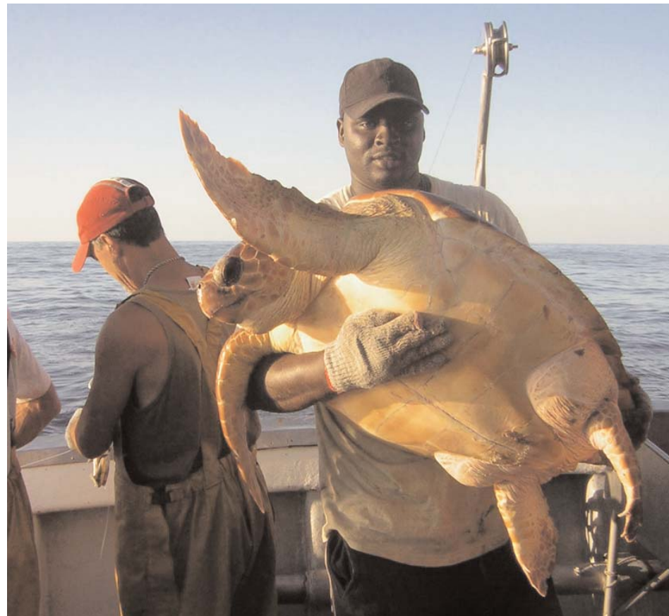
Ejemplar de Caretta caretta inmediatamente antes de ser liberado.

Entre las especies asociadas a la pesca de pez espada con palangre de superficie sobresalieron Dasyatis pastinaca (chuchos) con 2.288 ejemplares capturados, lo que significa un 23,60% del total. De tintorera ( Prionace glauca ) se capturaron 287 individuos