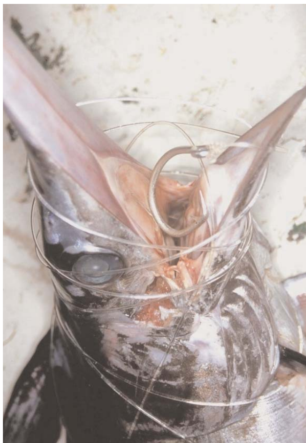
Con el uso de anzuelos circulares disminuyeron los rendimientos de pez espada juvenil.

Uno de los objetivos de la pesca experimental fue aumentar el conocimiento científico sobre el pez espada para asegurar el futuro de la pesquería a través de la obtención de datos biológicos