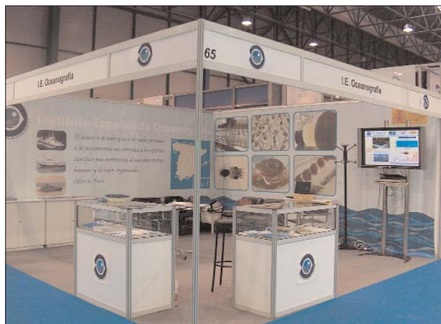
Stand del Instituto Español de Oceanografía (IEO).

E l IEO y 40 empresas de acuicultura de España, Bélgica, Italia, Grecia, Argentina, Brasil, Honduras, Colombia y Chile se han reunido en Villargadía de Arosa para estudiar la posible creación de un marco de negociación sobre los diferentes procedimientos para la diferenciación de la calidad de los productos de acuicultura en Europa y América Latina. En la reunión se analizaron también las metodologías, estrategias, normativas y sistemas para asegurar la calidad y el modo de avanzar en un mayor conocimiento para garantizar una producción acuícola que sea compatible con la conservación y protección ambiental.